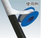
ニチアス株式会社[743057]

特長 ●ねじ継手に巻くだけで簡単にシールできます ●摩擦係数が小さくねじ込みが簡単で、焼付もなく脱着も非常に簡単です。 用途 ●水・蒸気・油・化学薬品・溶剤などの配管ねじ継手シールに。 ●ボルトやナット部のシール。 仕様 ●使用温度範囲:-200℃～260℃ 材質 ●フッ素樹脂(PTFE) 製造国 ●マレーシア