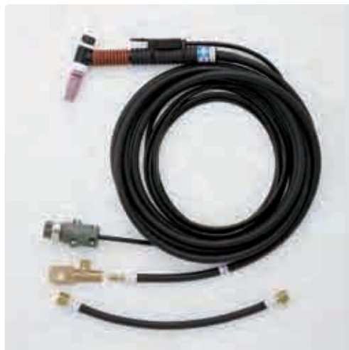
トーチセットイメージ WP-150-12R-1726