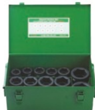
6WS-S11(ショートソケットセット)