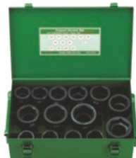
6WA-S14(セミロングソケットセット)