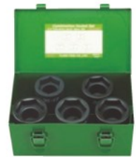
8WBQ-S5(コンビソケットセット)