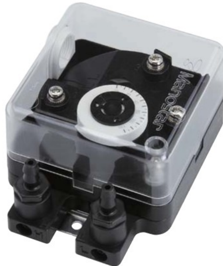
MS99 C形 (口金交換型)