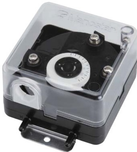
MS99 V形 (口金一体型)