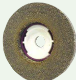
SG 鏡面一発ディスク #240