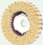
SG サイザルディスク