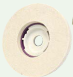
SG フェルトディスク