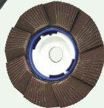
SG クールトップ #120

研磨・バリ取り作業に バフ作業前の仕上げ研磨に バフ作業前の仕上げ研磨に フェルトディスクの前に 鏡面仕上げに