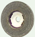
SG 鏡面一発ディスク #400