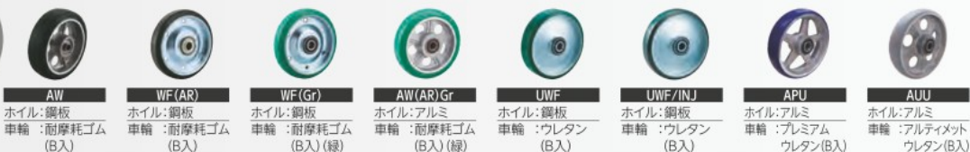
AW ホイル: 鋼板 車輪: 耐摩耗ゴム(B入) WF(AR) ホイル: 鋼板 車輪: 耐摩耗ゴム(B入) WF(Gr) ホイル: 鋼板 車輪: 耐摩耗ゴム(B入)(緑) AW(AR)Gr ホイル: アルミ 車輪: 耐摩耗ゴム(B入)(緑) UWF ホイル: 鋼板 車輪: ウレタン(B入) UWF/INJ ホイル: 鋼板 車輪: ウレタン(B入) APU ホイル: アルミ 車輪: プレミアムウレタン(B入) AUU ホイル: アルミ 車輪: アルティメットウレタン(B入)